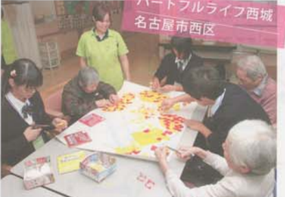
ハートフルライフ西城 名古屋市西区