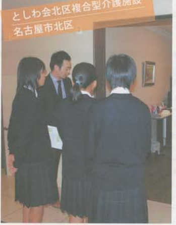
としわ会北区複合型介護施設 名古屋市北区