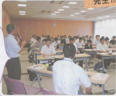
テーマは、「ユニットケアの特徴（介護現場の現状と課題）」及び「施設と学校との連携について（実習指導）」