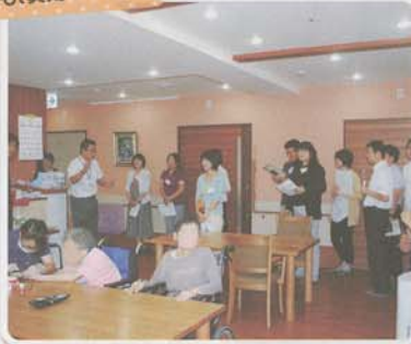
実際に、「ユニット型の居室スペース」を視察し、説明を聞く参加者。