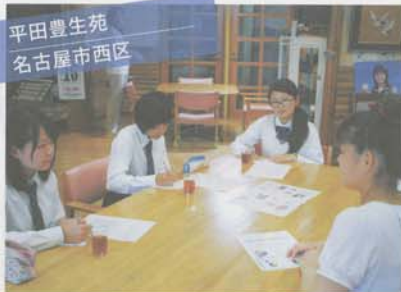
平田豊生苑 名古屋市西区