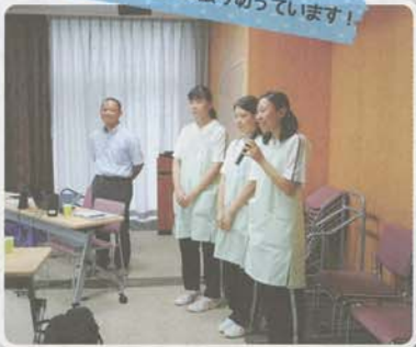
「オーネスト名城」で実習中の西陵高校の生徒（2年生）が実習の感想を発表しました。「学校で学んだ事を現場で体験でき、良かった」など。